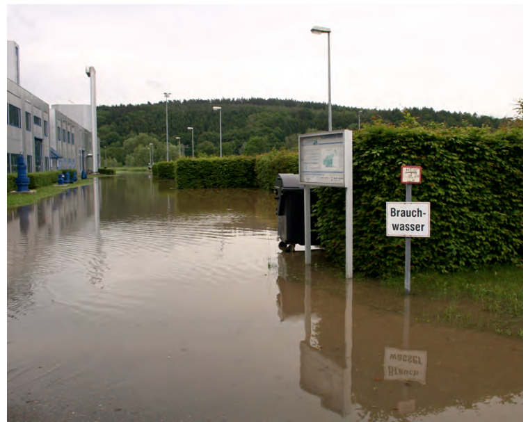
Überschwemmung auch vor dem Betriebsgebäude im Klärwerk Gera.

Der Betrieb des Klärwerkes konnte aber kontinuierlich aufrecht erhalten werden. Im Vordergrund steht nun die Kontrolle und Inbetriebnahme von Pumpwerken und Regenüberlaufbecken, welche vom Hochwasser betroffen waren. Das Geraer Hofwiesenbad bleibt bis auf weiteres geschlossen. Der Brunnen im Küchengarten und die Stadtbeleuchtung funktionieren dagegen wieder.