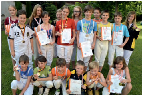
Die Nachwuchsfechter des TuS Osterburg Weida vor der Sommerpause.

Auch in Saalfeld holten sich die Weidaer Fechter den Sieg in der Gesamtwertung und sind nach Abschluss einer langen, spannenden und erfolgreichen Saison im Nachwuchsleistungssport die Nummer 1 in Thüringen.