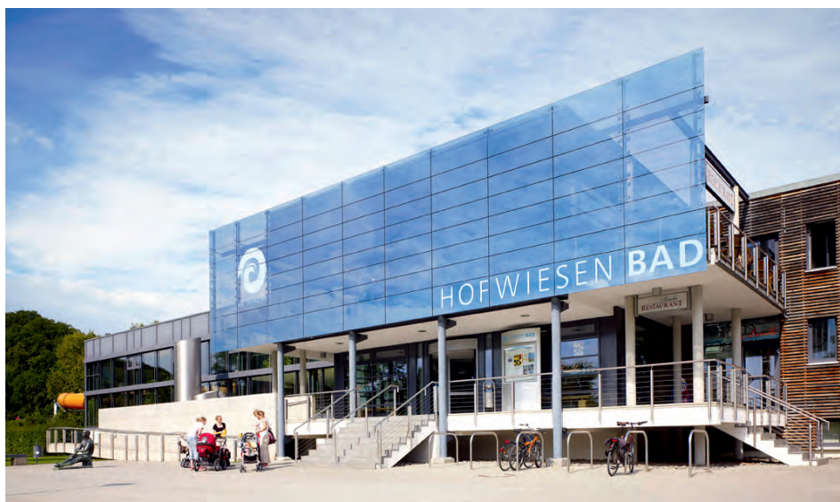
Das Hofwiesenbad öffnet zum 24.12. wieder seine Türen.

Im Juni hatten Feuerwehr-Kameraden und Bad-Mitarbeiter bis zuletzt versucht, die Keller wieder leer zu pumpen; doch irgendwann mussten sie aufgeben, weil immer mehr Wasser ankam und ihre Arbeit zu gefährlich wurde. Bis zu 1,60 Meter hatte das Bad unter Wasser gestanden; die Nässe war ins Mauerwerk eingezogen. 15 Kilometer Niederspannungsleitungen mussten überprüft und zum Teil ersetzt werden. 85 Prozent der bädertypischen Spezialtechnik war ruiniert. Die Belüftungstechnik fiel dem Wasser zum Opfer. Die Mess- und Steuerungstechnik ebenfalls. Die Umwälzpumpen waren nicht mehr brauchbar. Einige mussten repariert werden – und kommen jetzt als Übergangslösung zum Einsatz. „Ansonsten hätten wir den Eröffnungstermin nicht halten können“, schildert Fiß.