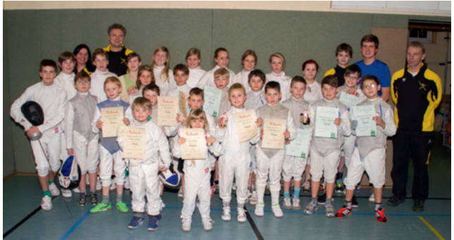
Nach dem Weihnachtsfechten am Dienstag - die Nachwuchsfechter mit dem Trainer, Übungsleitern und Kampfrichtern

Am Dienstagabend fand für die Weidaer Fechter das letzte Turnier im Jahr 2013 statt. Das traditionelle Weihnachtsfechten der Nachwuchssportler war, vor allem für die ganz Kleinen, ein tolles Erlebnis. Mit insgesamt 15 Titeln bei Thüringer und mitteldeutschen Meisterschaften sowie zahlreichen Erfolgen bei nationalen und internationalen Turnieren zählen die Osterburgstädter auch 2013 zu den erfolgreichsten Vereinen des Thüringer Fechtverbandes. Am 01. und 02. März 2014 richtet die Abteilung Fechten die Turniere um den Osterburgpokal in Harpersdorf zum 20. Mal aus. ... und ... am 01. März 1989 erfolgte die Gründung der Sportgruppe Fechten an der Max-Greil-Schule.