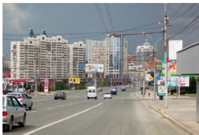
Das Zentrum von Novosibirsk

Strahlender Sonnenschein! Bereits auf dem Weg zu meiner im Internet gefundenen Unterkunft ein Wolkenbruch, der den gesamten Straßenverkehr von Novosibirsk lahmlegte. Nach 1,5 Stunden – Gefahr von Sonnenbrand! Dieser Wechsel des Wetters ist hier typisch, wo man selbst vom Flugzeug aus keinen Berg oder die geringste Erhebung in der Landschaft erkennt. Nur die Skyline der Stadt und die unendliche Weite der mit Wasserläufen durchzogenen Taiga ist zu sehen. Kein Wunder, dass man kaum jemanden mit einem Regenschirm sieht, man stellt sich lieber mal kurz unter.