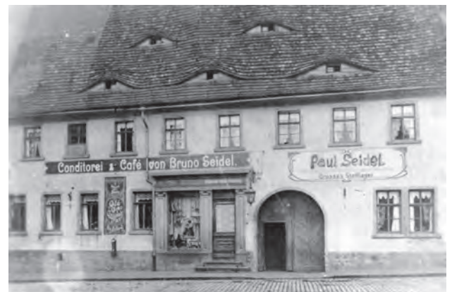
Markt 5. „Café Seidel“ 1903.

1952 erfolgte eine Neueröffnung durch die HO mit neuem Namen „Café am Markt“.