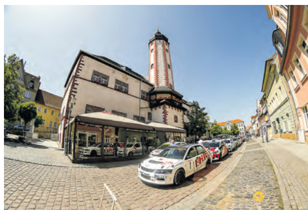
Zwangspause 2025 auf dem Weidaer Marktplatz

Ein weiterer Publikumsmagnet dürfte die große Zwangspause auf dem Weidaer Marktplatz ab etwa 13.30 Uhr werden. Dort können Fans die Fahrzeuge und Teams aus nächster Nähe erleben.