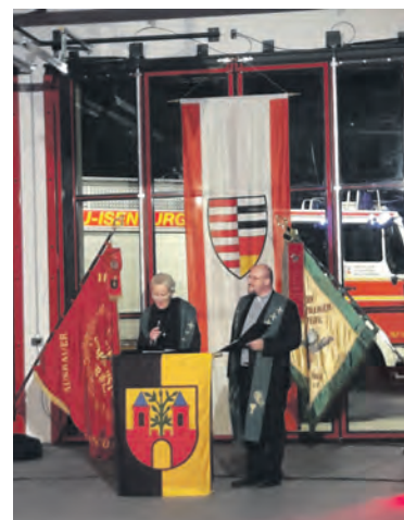
Foto von der Einweihung des Neubaus am 4.11.2017 – Mit Gottes Segen in die Zukunft!