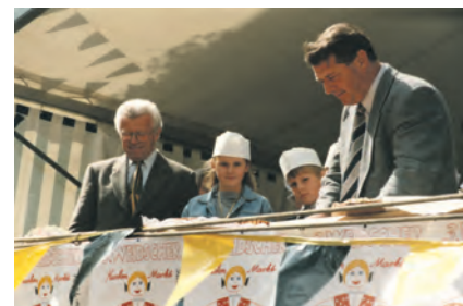
3. Kuchenmarkt 1996