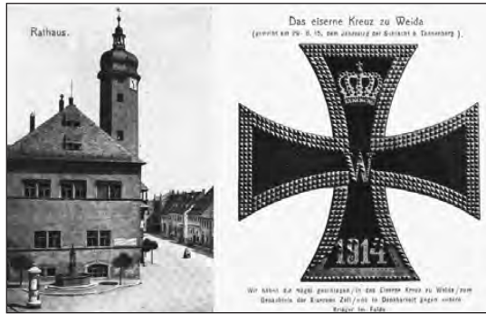
Fleißige Helferinnen verkauften die Karte in den Häusern

Im März des Jahres 1917 wurden die aus Zinn bestehenden Orgelpfeifen unserer Stadtkirche erst einmal beschlagnahmt und am 4. Juli ausgebaut.