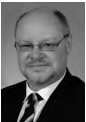
Autor Rechtsanwalt Thomas Jahn Fachanwalt für Verkehrsrecht