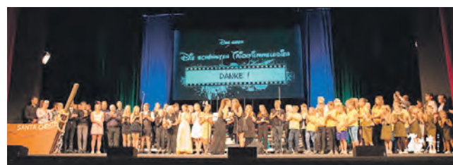
Das Harmonika Jugendorchester Weida

Am 26. August war es dann soweit. Die Vogtlandhalle in Greiz öffnete für unser großes Event ihre Türen. Am frühen Nachmittag sorgten zunächst die jüngeren Schüler mit ihrem Programm für eine grandiose Atmosphäre und stimmten die Zuschauer musikalisch ein. Unser Orchester präsentierte im Anschluss „Die schönsten Trickfilmmelodien“ und begeisterte damit ein zahlreiches Publikum. Unterstützt wurden wir dieses Jahr erstmals von vielen Tänzern, Akrobaten, Musikern und Sängern, welche das Programm mit ihren Darbietungen bereicherten. Das Konzert war ein voller Erfolg. Mit