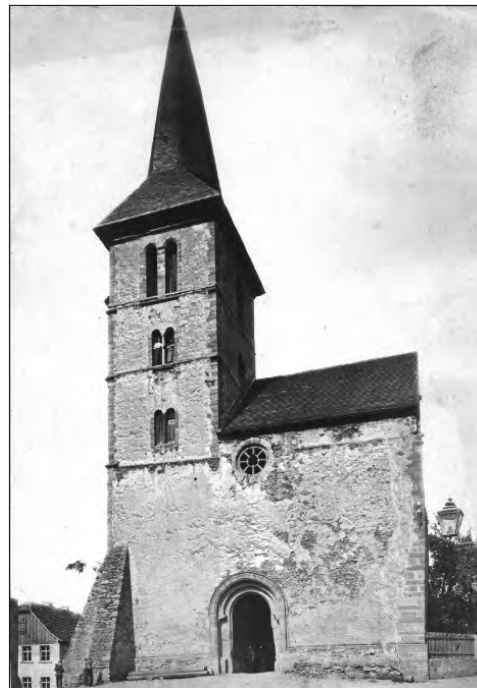
Auch die Wiedenkirche mußte eine Glocke opfern

Große Befürchtungen bestanden zu Recht, dass auch Kirchenglocken geopfert werden müssen. Am 20. Juni ist die kleine Glocke auf dem Petersturm und am 21. Juni die mittlere Glocke auf der Wiedenkirche herabgenommen worden.