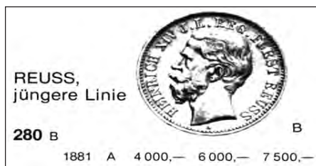
20 Mark Goldmünze (Katalog 1991)

Die Goldreserven der Reichsbank verringerten sich immer mehr. Gold musste beschafft werden. In Weida gingen Realschüler von Haushalt zu Haushalt und kauften Goldstücke für Papiergeld auf. Auch die umliegenden Dörfer haben die Schüler aufgesucht. Im August des Jahres 1915 kamen für 22630 Mark Goldmünzen zusammen. Eine Nachlese durch die Töchterchule erbrachte ebenfalls noch 1320 Mark. Wieviel numismatische Seltenheiten dabei vernichtet wurden, ist nicht mehr festzustellen.