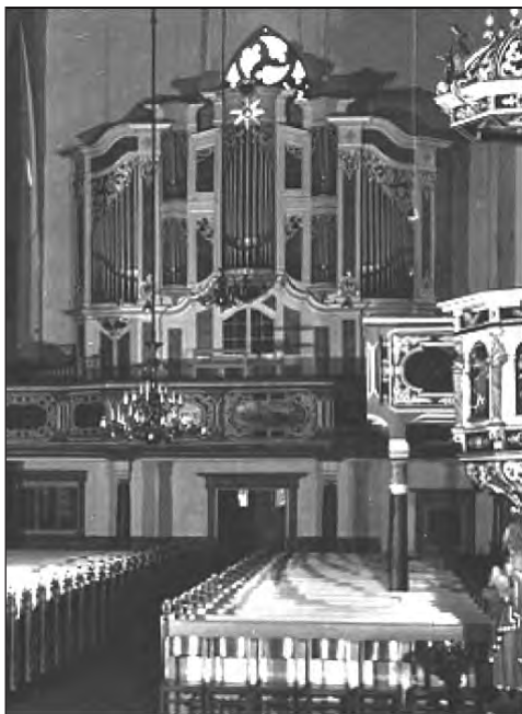
Blick auf die Orgel der Stadtkirche zu Weida

Besonders respektlos wurde mit der Glocke der Wiedenkirche verfahren. Sie hat man aus luftiger Höhe einfach in die Tiefe gestürzt. Auf jeden der Türme sind noch 2 Glocken verblieben.