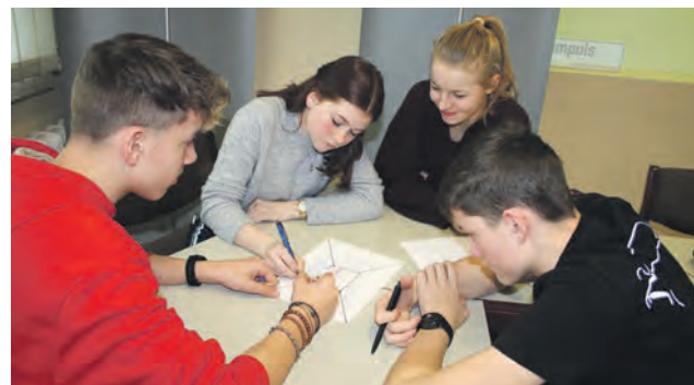
(Auf dem Foto zu sehen Schülerinnen und Schüler der Klasse 9b während des Projektes)