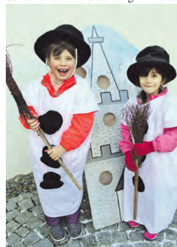
Einmal Schneemann sein am Welttag des Schneemanns.

Die Ausflüge der Vorschulkinder der Johanniter-Kita „Freundschaft“ in Weida gehen weiter. Im Dezember verschlug es die Mädchen und Jungen in das unterirdische Gera. Die Besichtigung der historischen Höhlen stand auf dem Ausflugsplan. Ausgerüstet mit Taschenlampen ging es in die künstlich angelegten Hohlräume unter den eigentlichen Kellern der Häuser der Altstadt. Sogar ein Schatz aus Mineralsteinen wurde gefunden. Im Anschluss gab es noch einen Besuch auf dem Geraer Weihnachtsmarkt, wo die Märchenbilder für Begeisterung sorgten. Zum Welttag des Schneemanns, am 18. Januar 2019, führte der monatliche Ausflug die künftigen ABC-Schützen auf die Osterburg in Weida. An verschiedenen Stationen