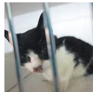
Euer Tierheim Team