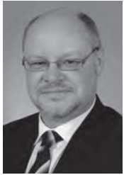
Autor Rechtsanwalt Thomas Jahn Fachanwalt für Verkehrsrecht