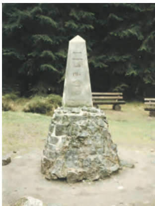
Rennsteig-Dreistromstein bei Siegmundsburg