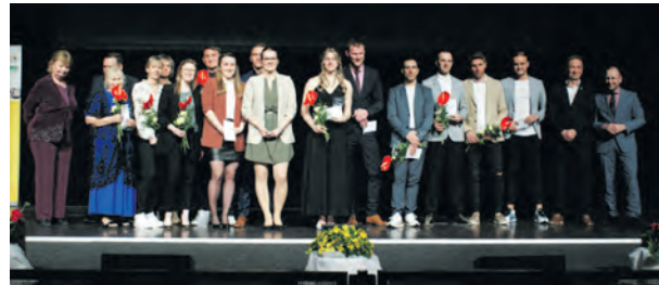
Die populärsten Sportler und Mannschaften auf einem Bild

Ein Statement, welches von den Zuschauern großen Beifall bekam.