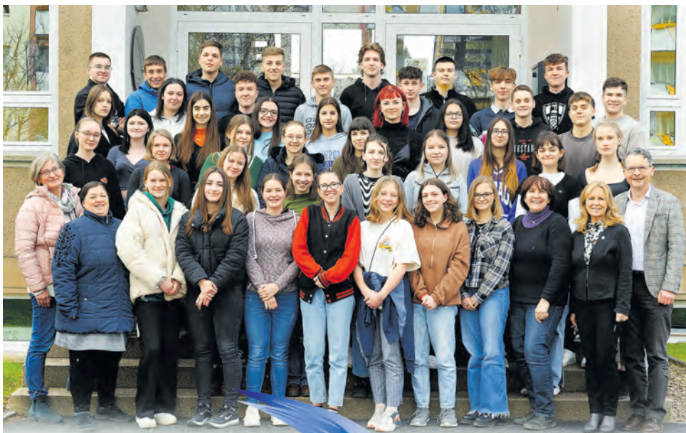
G.-S.-Dörffel-Gymnasium Weida Schulpartnerschaft Mezötúr - Weida 2023

Bei so viel Wertschätzung erlebt man auch als Weidaer die Stadt wieder ganz neu. Einen emotionalen Höhepunkt stellte der Abschlussabend am Donnerstag im Bürgerhaus Weidas dar. Nach kurzen Reden, ausgiebigem Pizzaessen und dem Genuss vielfältiger Salate aus der „Grünen Küche“ des Dörffelgymnasiums, fanden sich alle an der Schülerbegegnung Beteiligten zu einem Volkstanzvergnügen zusammen. Einem Tanzlehrer aus Berlin gelang es, mit einem abwechslungsreichen Programm eine wunderbare Atmosphäre zu schaffen und Jung und Alt zur gemeinsamen rhythmischen Bewegung zu motivieren. Entsprechend wehmütig gestaltete sich der Abschied am Freitagmorgen. Wir freuen uns schon auf ein Wiedersehen im Herbst in Mezötúr.