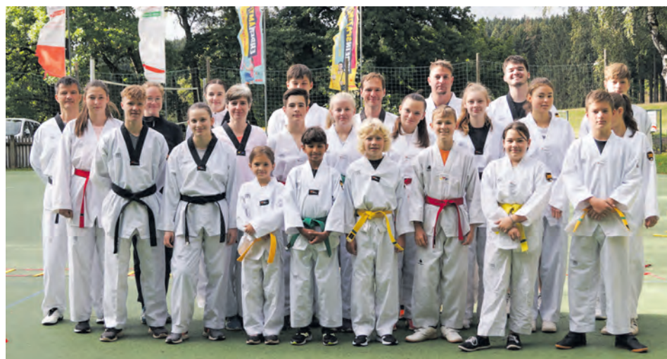
Alle Teilnehmenden am Trainingswochenende

Ein großes Dankeschön geht an die TEAG Thüringer Energie und das Weidaer Reisebüro Fischer, die uns für dieses Trainingswochenende finanziell unterstützt haben.