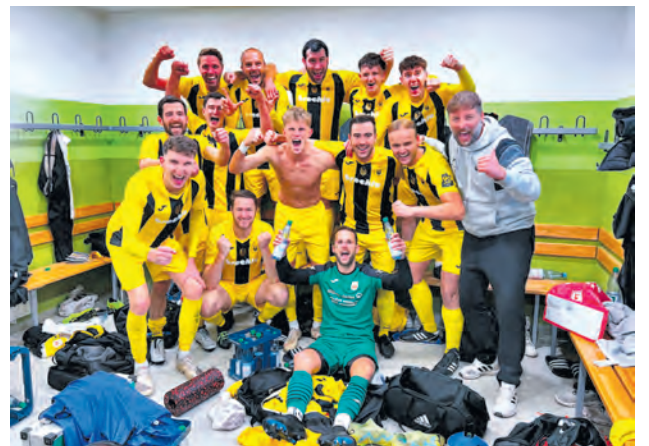
Ausgelassener Jubel nach dem Sieg beim BSV Eintracht Sondershausen. Seit 2005 gewinnen die Weidaer erstmals wieder im Stadion am Göldner.